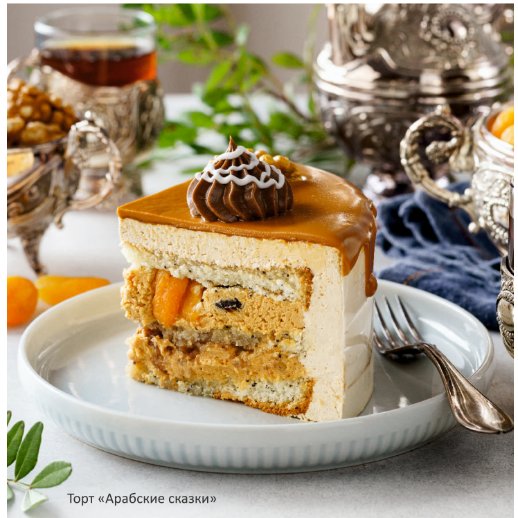
Торт «Арабские сказки»