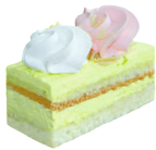
Фисташковое Лакомого мира

Бисквитное пирожное с фисташковым кремом.