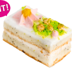
Королевское Лакомого мира

Бисквит с маком, крем с вареной сгущенкой, арахисом и изюмом.