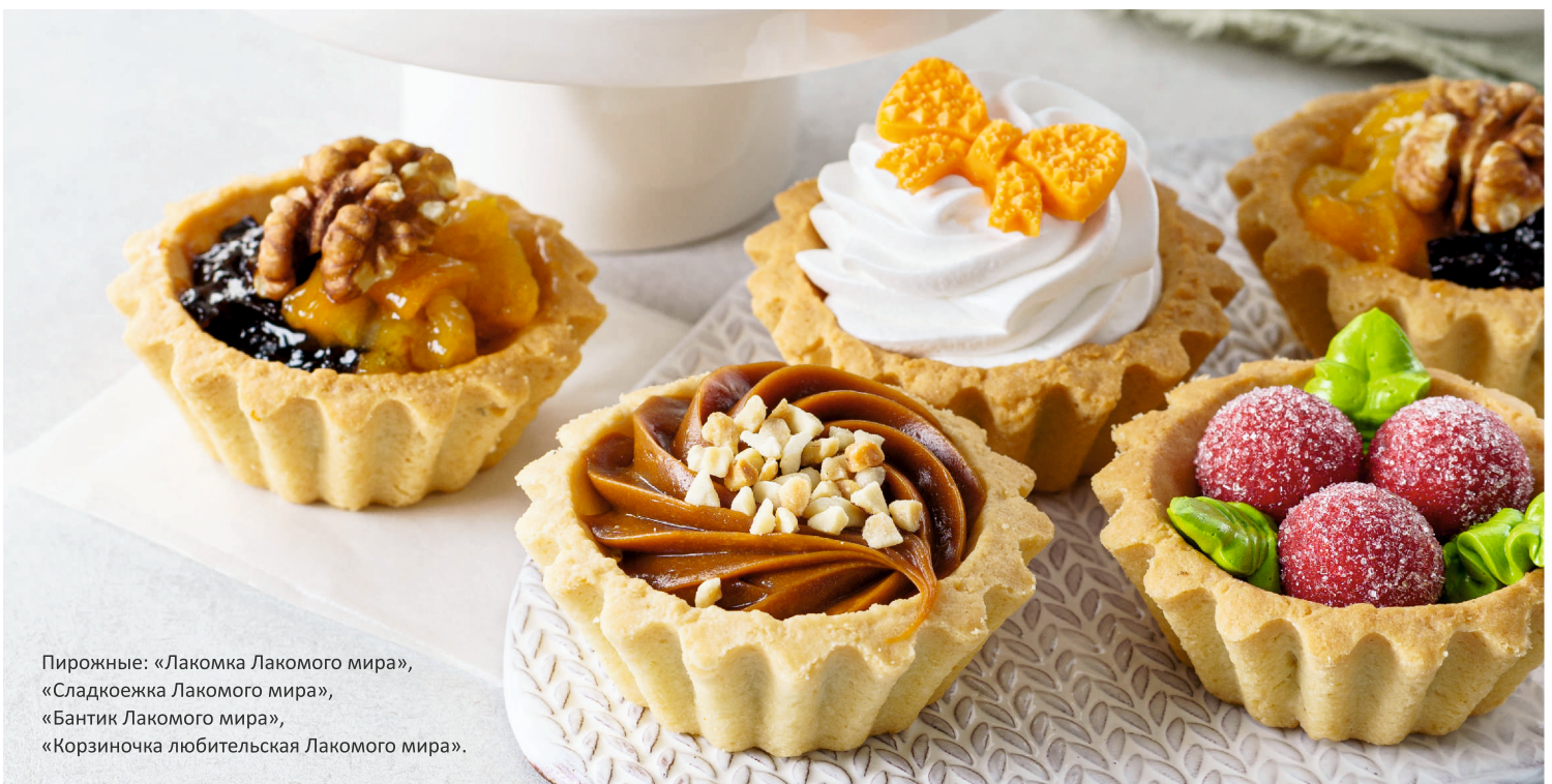
Пирожные: «Лакомка Лакогого мира», «Сладкоежка Лакогого мира», «Бантик Лакогого мира», «Корзиночка любительская Лакогого мира».