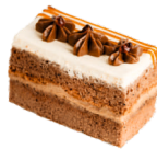
Пражское Лакомого мира

Шоколадный бисквит с «Пражским» кремом и сливками.