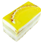
Ананасовое Лакомого мира

Бисквитное пирожное с ананасовой начинкой.