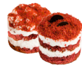
Красный бархат Лакомого мира

Бисквит красного цвета, масляный крем с сырной начинкой "Чизкейк".