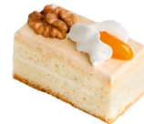
Восточные сказки с курагой

Бисквитное пирожное, крем с курагой и грецким орехом.