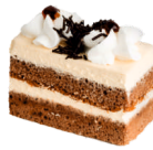
Крем-брюле Лакомого мира

Шоколадный бисквит с кремом «Крем-брюле».