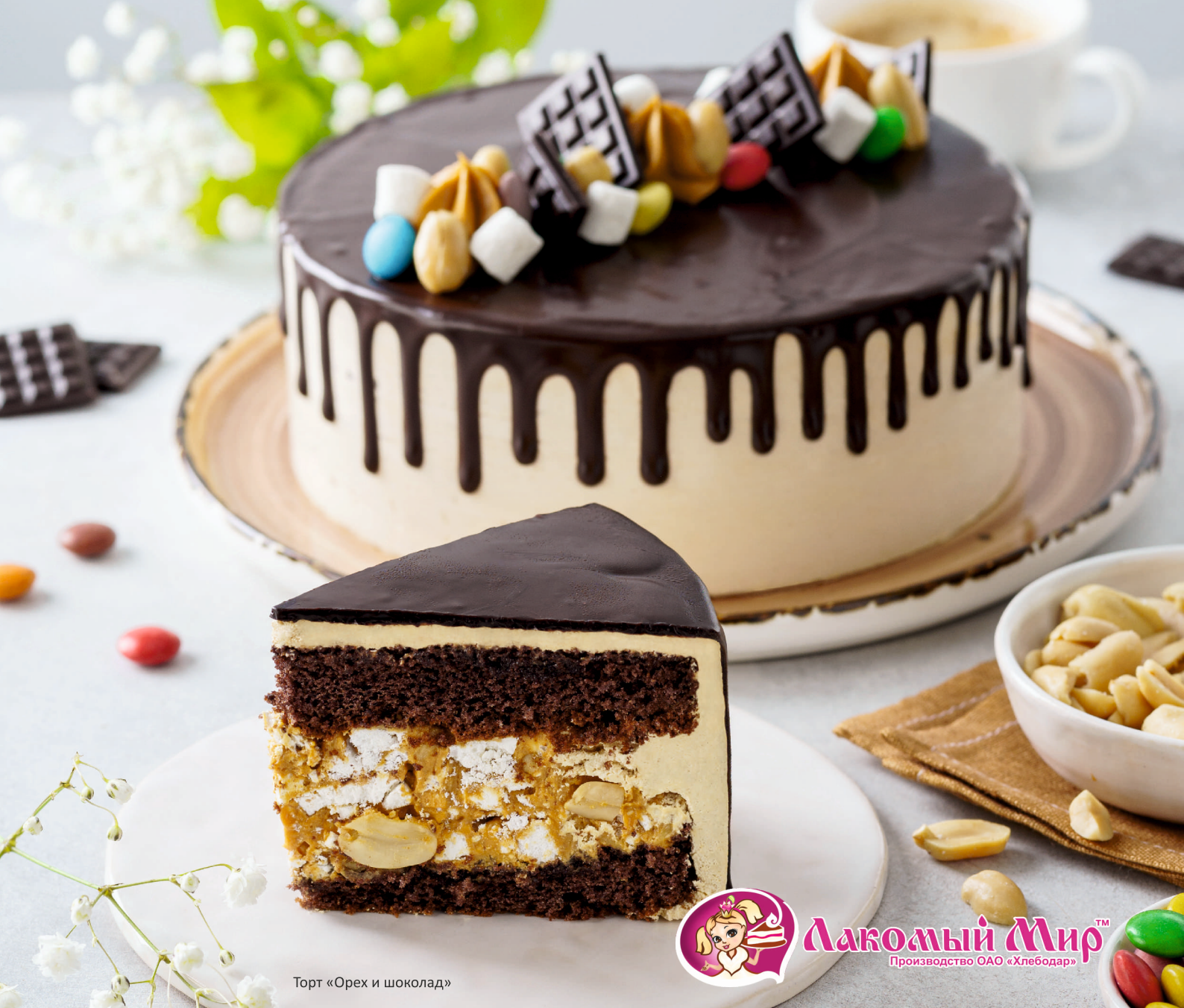
Торт «Орех и шоколад»