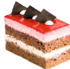
Клюковка Лакомого мира

Два слоя шоколадного бисквита, сливки с творожно-йогуртовым кремом.